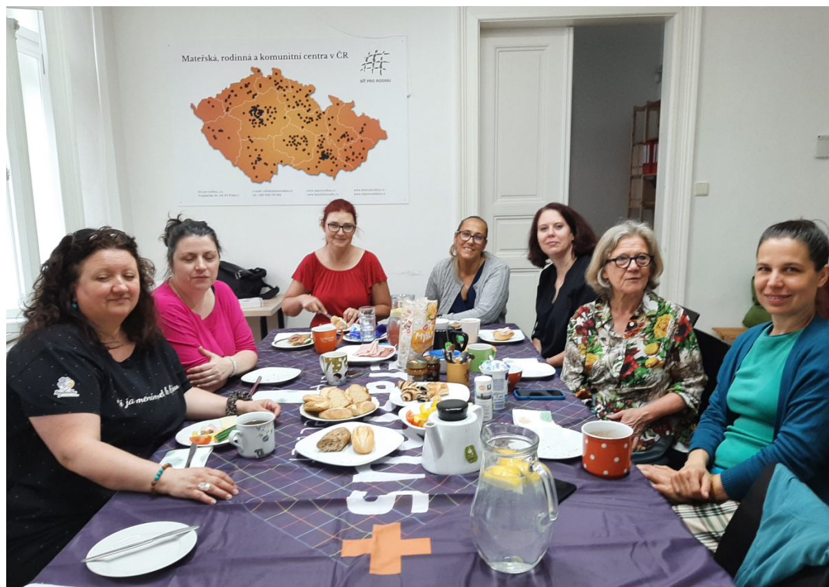
Bijeenkomst in Praag van het Erasmus+ project, met deelnemers Tsjechië, Slowakije, Duitsland Hongarije en Nederland

Daarnaast is in 2024 steun gegeven aan twee kleinschalig Servische groepen.