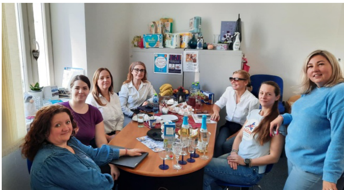
Regio West - Galanta-Treffen